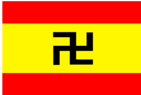
Bandera oficial de la revolución

Asimismo, fue aprobada que la bandera de la cruz gamada sería utilizada como bandera representativa de la Revolución Dule de 1925. La misma sería la bandera oficial para las festividades de la revolución durante el mes de febrero.