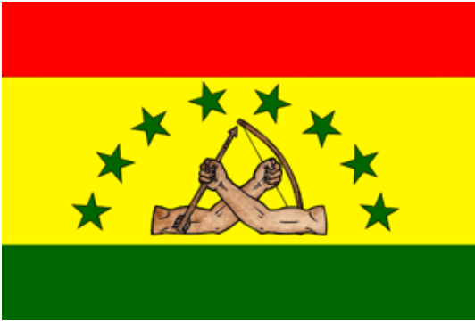
Bandera oficial de Gunayala

Durante el Congreso General Guna celebrado en Mammidub, sesión ordinaria, los días 28 al 31 de octubre de 2010, se oficializó la bandera de las 8 (ocho) estrellas y dos antebrazos con arco y fecha. A partir de la fecha dicha bandera será ondeada en todas las comunidades e instituciones públicas junto a la bandera panameña.